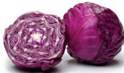
Quercetine zit in appels, uien, rode kool, rode druiven, frambozen, groene thee en knoflook.

Vet in de voeding bevordert de opname van quercetine